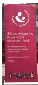
ROLL-UP inkl. Tragetasche