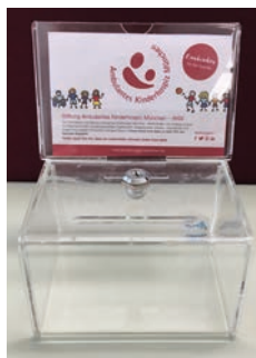
SPENDENBOX MITTEL 16 x 11 cm, Höhe 21cm

Folgendes Spenden-Equipment können wir Ihnen zukommen lassen: