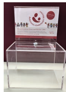
SPENDENBOX GROSS 22 x 16 cm, Höhe 33 cm