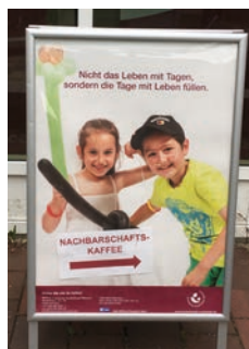
KLAPPAUFSTELLER für Postergöße DIN A1 (inkl. Poster)